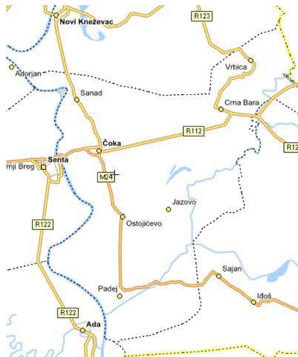
Карта 2. Положај насеља у Општини Чока

Чока као највеће насеље представља центар општине. Територија општине има површину од 321 км 2 . (карта бр.2)