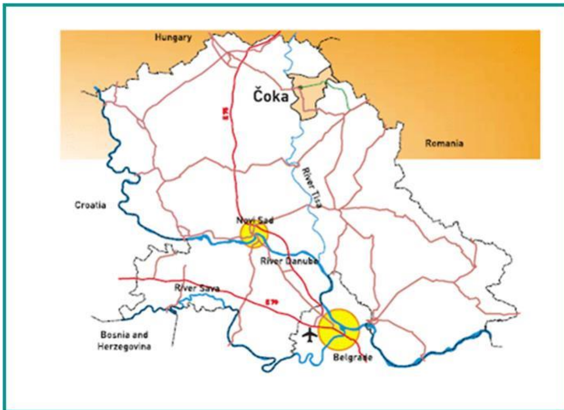
Карта 1. Положај Општине Чока у региону

Чоканску општину сачињавају осам насеља: Чока, Остојићево, Падеј, Јазово, Санад, Врбица, Црна Бара и Банатски Моноштор.