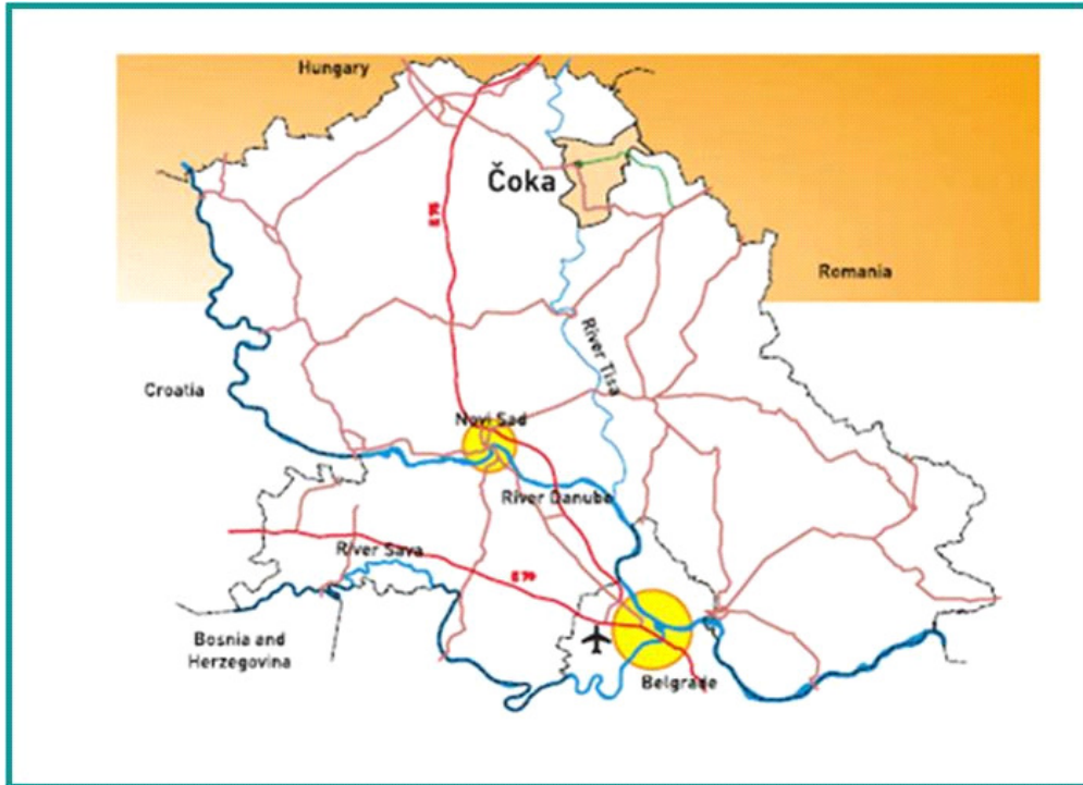
Карта 1. Положај Општине Чока у региону

На истоку једним делом избија на државну границу према Румунији.