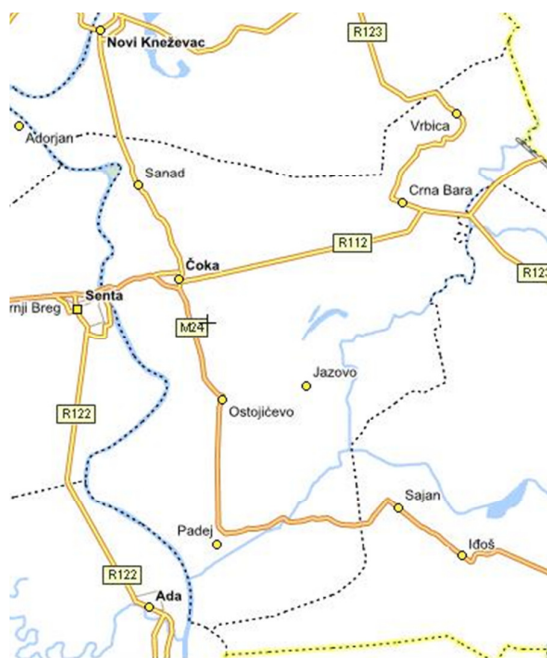
Карта 2. Положај насеља у Општини Чока

Чока као највеће насеље представља центар општине. Територија општине има површину од 321 км 2 . (карта бр.2)